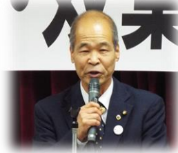
上壁充社民党いわき・双葉総支部代表