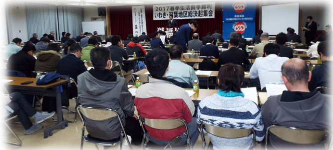
参集いただきました組合員の皆様