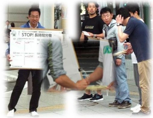
意識調査・署名活動の様子