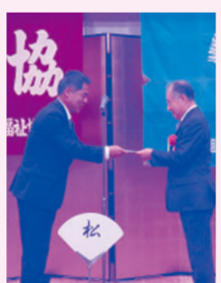
武社会津若松市協議会 贈呈

会津若松地区連合・会津若松地区労協共催の新春交歓会を開催。多くのご来賓・そして構成組織・単組の多くの仲間が参加、新年のスタートにあたりそれぞれが健康で活躍されること願いました。