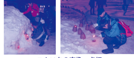
ロウソクの交換・点灯