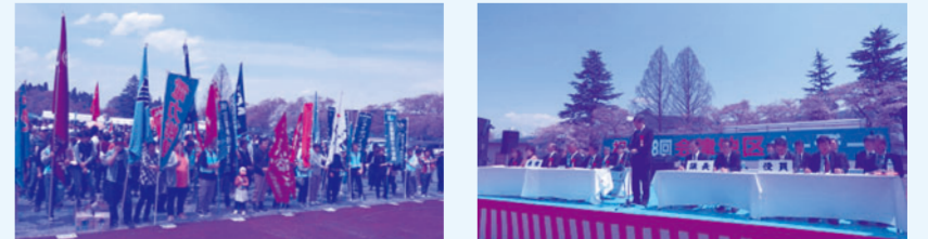
多くの仲間が結集、第88回式典の様子