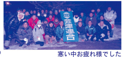
寒い中お疲れ様でした