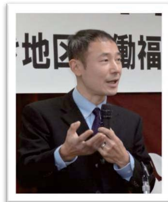
政治学者・森田浩之先生

森田先生は慶應義塾大学講師の傍ら政治・経済についての執筆や講演をされており、著書には『小さな大国 イギリス』（東洋経済新報社）、『情報社会のコスモロジー』（日本評論社）などがある。