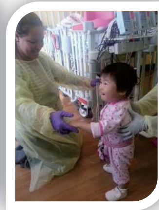
あおいちゃんの様子(米国での近況より)