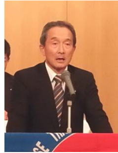
◇吉田泉衆議院議員