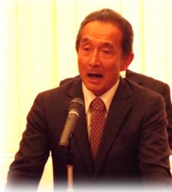
◇民主党代表：吉田泉氏