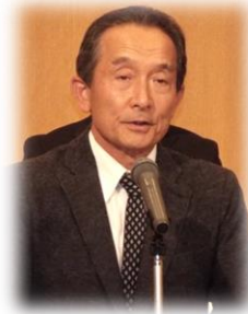
◇吉田泉前衆議院議員