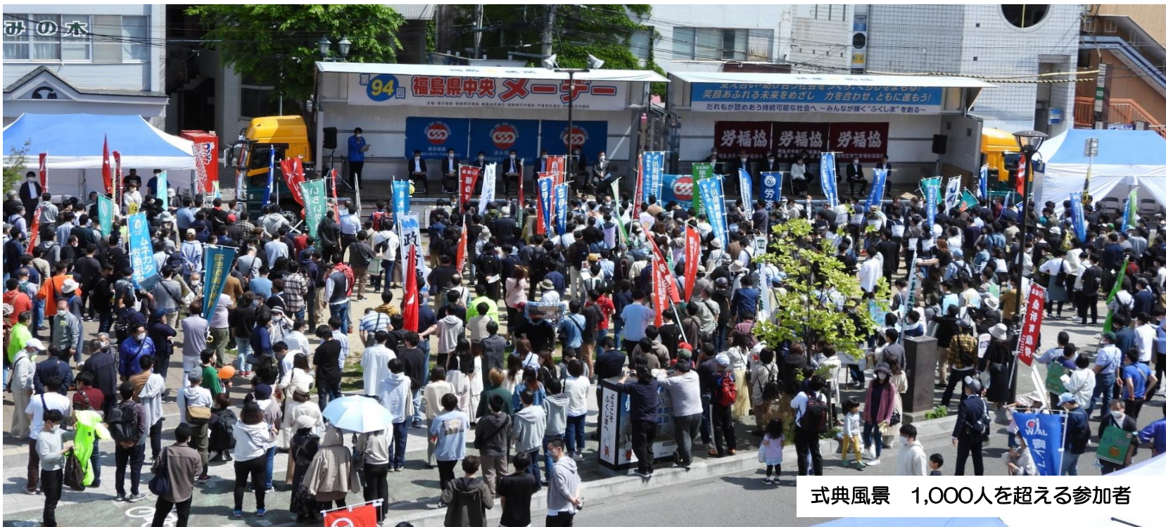
式典風景 1,000人を超える参加者