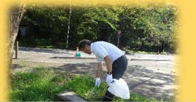
三村県議も参加しました