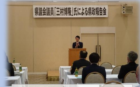
馬場ゆうき議員の激励挨拶