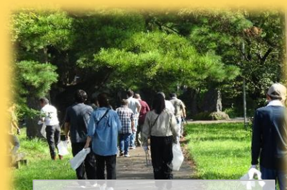
緑いっぱいの南湖公園