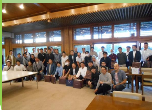
参加者のみなさん

県南地域の会員間の親睦を深める観点から、白河地区労福協と東白川地区労福協との共催により、標記「第27回秋季チャリティーゴルフコンペ」を開催いたしました。東西しらかわ地区より47名が参加し、その場で参加者より寄付を募りましたので、些少ではありますが、白河市社会福祉協議会に寄贈させていただきました。ご協力ありがとうございました。