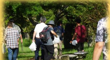
気温が高い日のゴミ拾い