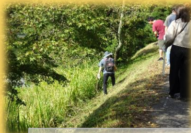
急斜面でのゴミ拾い

通年取り組みの「列島クリーンキャンペーン」を9/16(土) 8:30～南湖公園周辺で開催いたしました。45名の参加をいただきました。ご協力ありがとうございました。