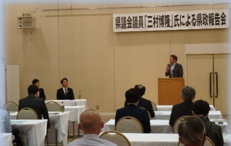
三村県議会議員の県政報告