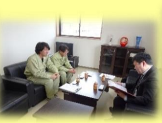
東北ポール労働組合白河支部