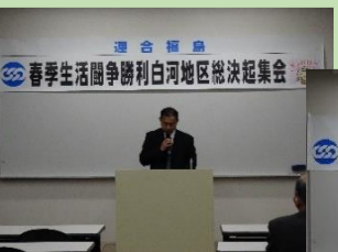
アズビル金門エナジープロダクツ白河労組の報告