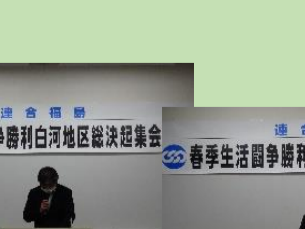
J P 労組福島県南支部の報告