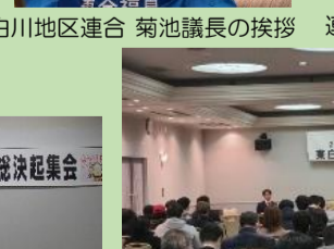
住友ゴム労組白河支部の報告