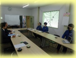
ケミコン東日本労働組合福島支部