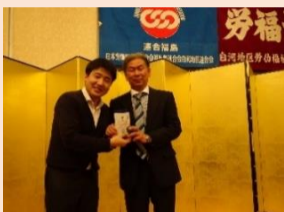
特賞を当てた幸運の持ち主