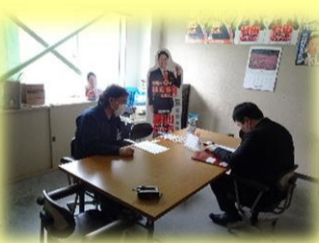
川金ダカスト工業労働組合