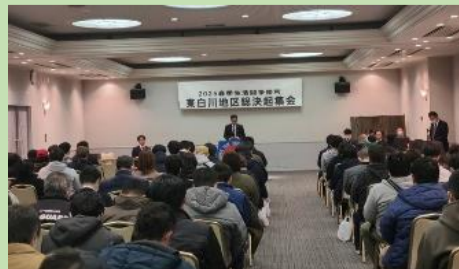
東白川地区連合総決起集会に参加された皆様