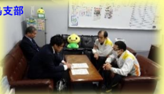
ユニ・チャームプロダクツ労働組合福島支部

2025春闘加盟組織オルグ訪問については、3月5日（水）6組織・6日（木）8組織に訪問を実施し情報交換・共有に努めました。全体的に生産数の減少・価格転嫁の現状・人員確保（若手含め）について、どの組織も苦労している現状がありました。