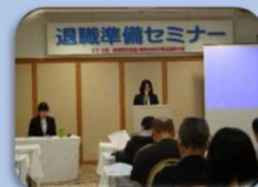
「白河市役所 3 講師の講義」