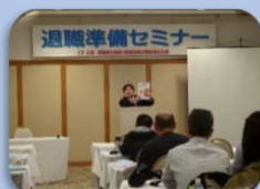
年金事務所の方の講義