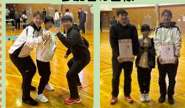
ファミリーチーム優勝！！ 住友ゴム労組白河支部チーム

連合福島・白河地区連合会 県南地域ネットワーク（子ども食堂）への寄贈 場所 「白河市 新蔵 渡辺魚店」