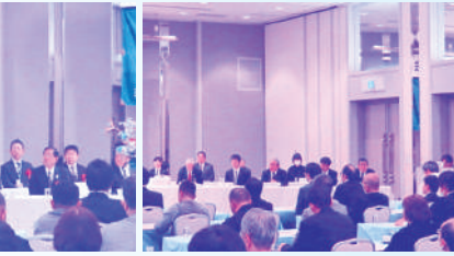
右側-地区連合役員