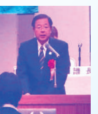
連合福島塩澤事務局長 連帯挨拶