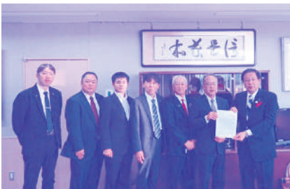
室井市長へ要請書提出