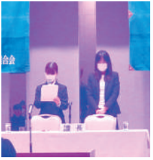
大会議長お疲れ様でした